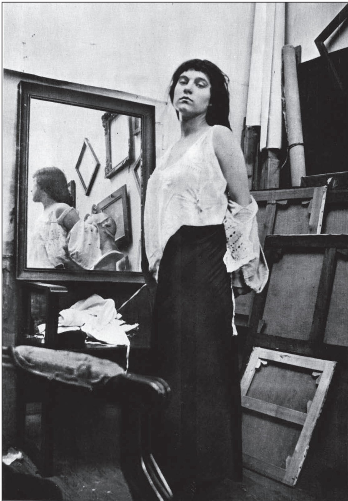
P. BONNARD - MODELLA CHE SI TOGLIE LA CAMICIA NELLO STUDIO DELL'ARTISTA (fotografia su carta all'argento - negativo originale 8 x 5,5 cm)